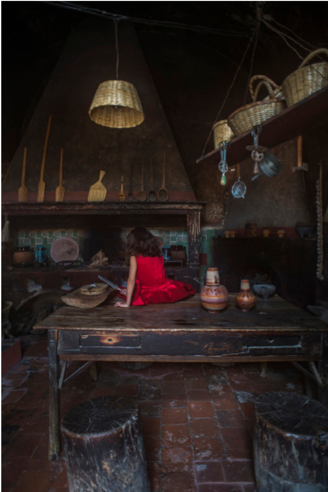
Título: Eager Continuity Año: 2019 Técnica: Digital Photography Tamaño: 13 x 18 cm Ed.: 10 Tamaño: 40 x 60 cm Ed.: 5