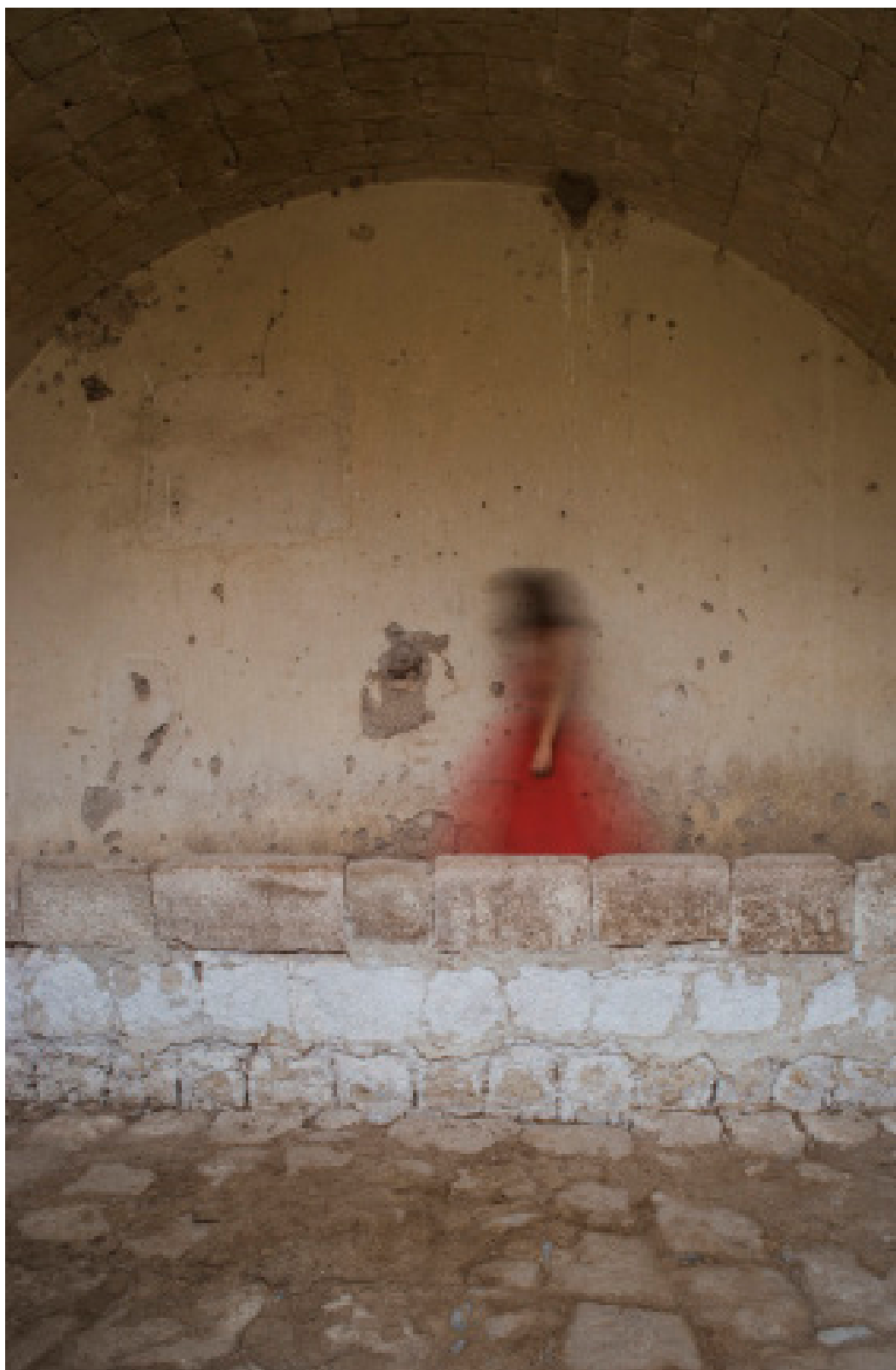
Título: Matter of Roots, Año: 2019 Técnica: Digital Photography Tamaño: 13 x 18 cm Ed.: 10 Tamaño: 40 x 60 cm Ed.: 5