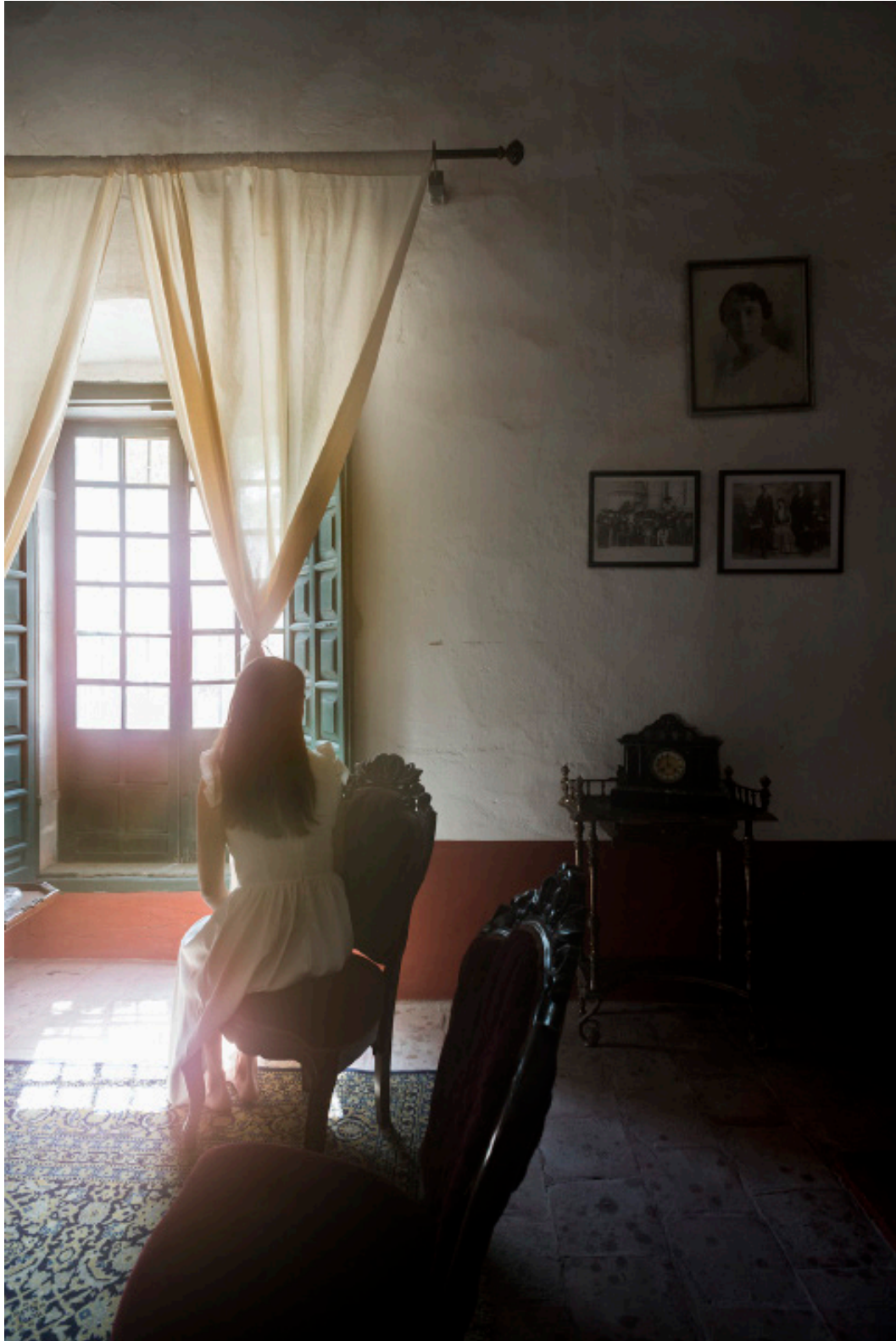
Título: Time of Denial Año: 2019 Técnica: Digital Photography Tamaño: 13 x 18 cm Ed.: 10 Tamaño: 40 x 60 cm Ed.: 5