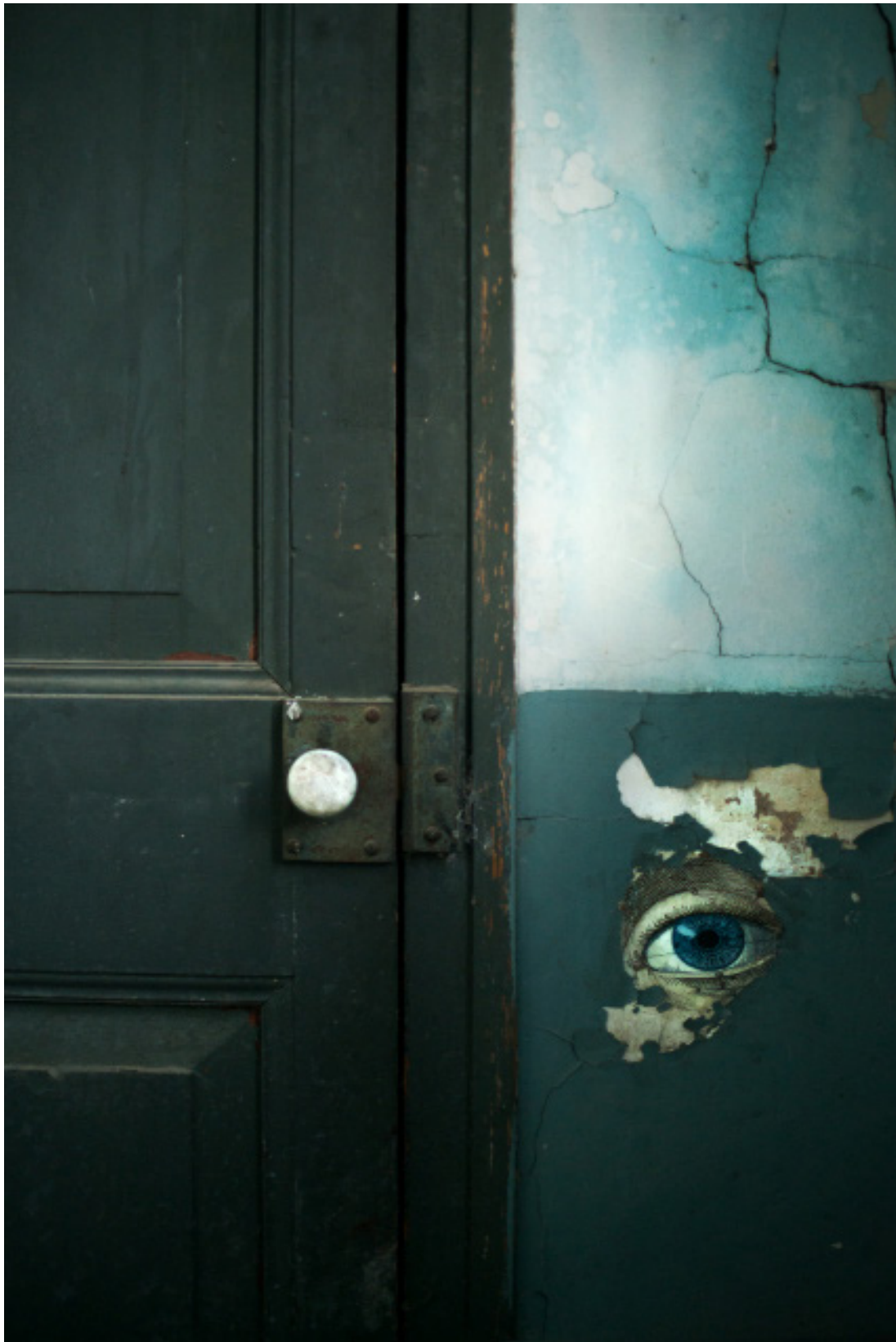
Título: Untitled I Año: 2017 Técnica: Digital Photography Tamaño: 30 x 40 cm Ed.: 10 Tamaño: 40 x 60 cm Ed.: 5