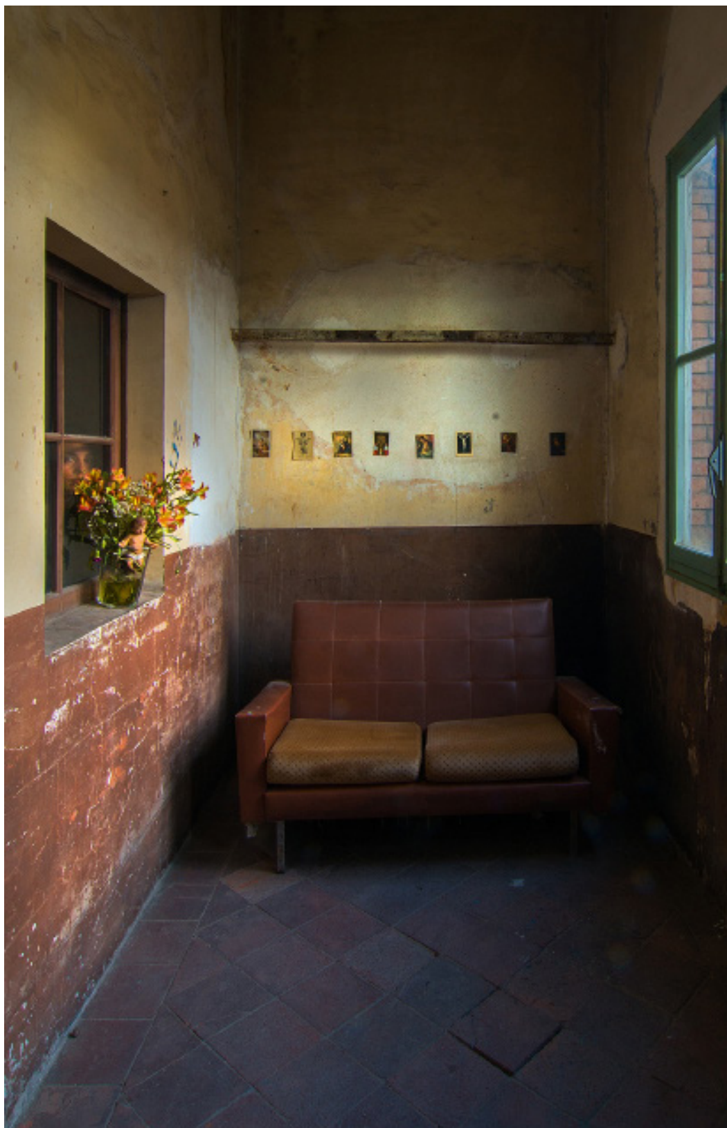
Título: Comfort Zone, Año: 2017 Técnica: Digital Photography Tamaño: 30 x 40 cm Ed.: 10 Tamaño: 40 x 60 cm Ed.: 5