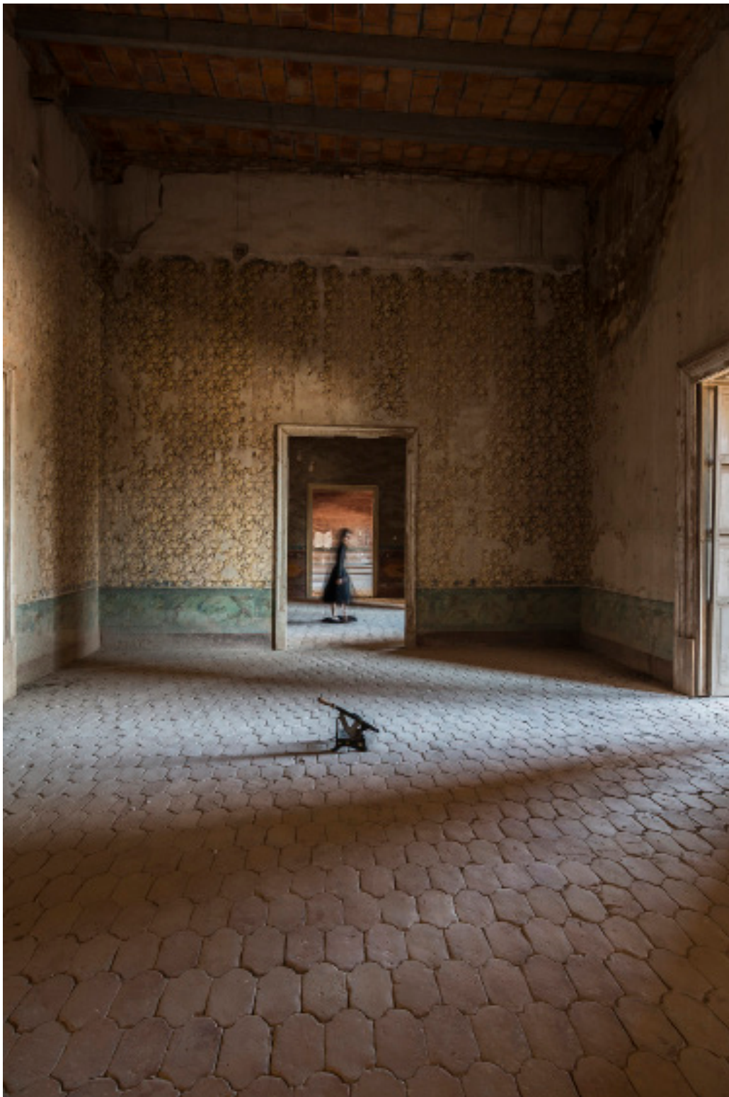
Título: Secret Wondering, Año: 2019 Técnica: Digital Photography Tamaño: 13 x 18 cm Ed.: 10 Tamaño: 40 x 60 cm Ed.: 5