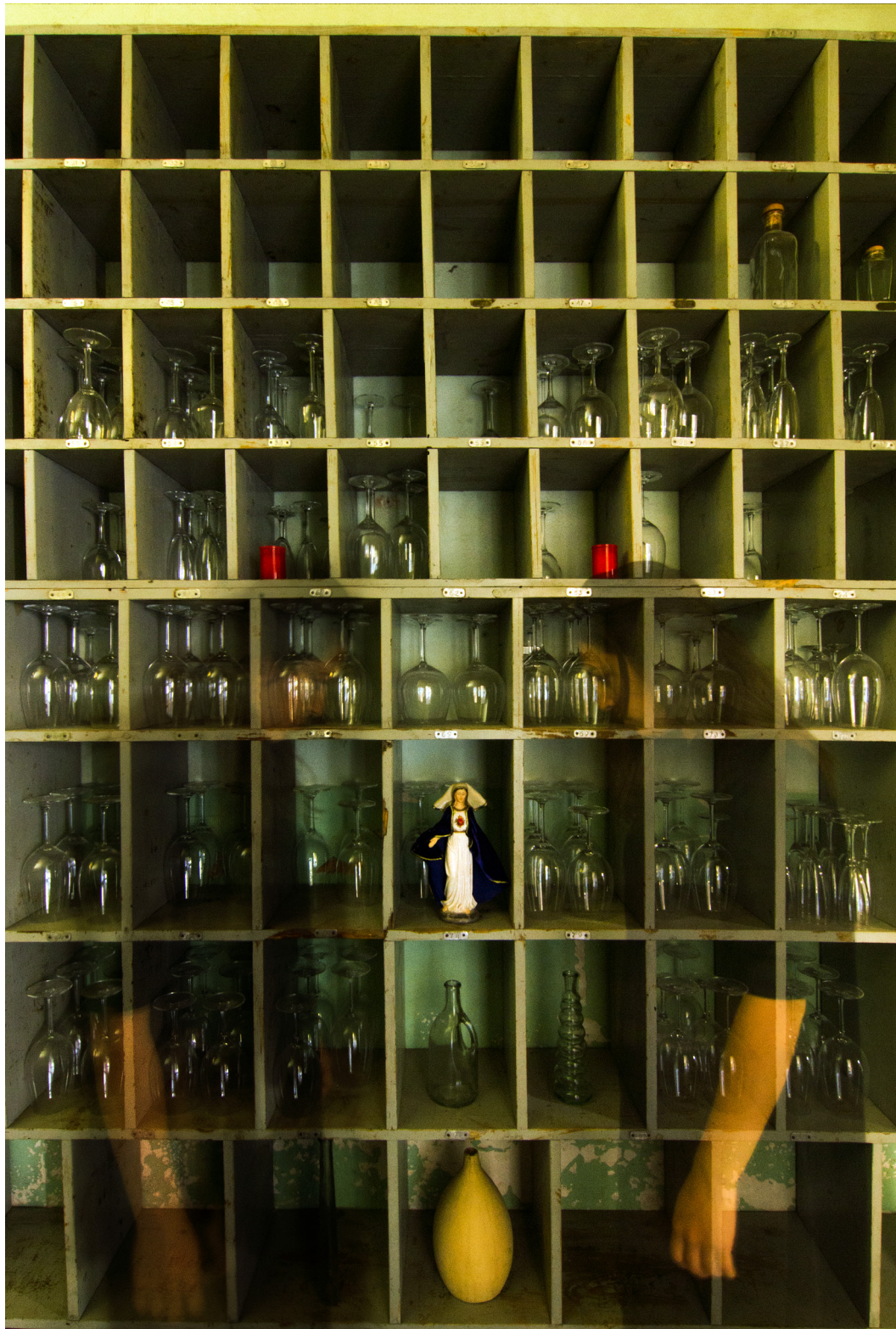
Título: Confrontation, Año: 2017 Técnica: Digital Photography Tamaño: 30 x 40 cm Ed.: 10 Tamaño: 40 x 60 cm Ed.: 5