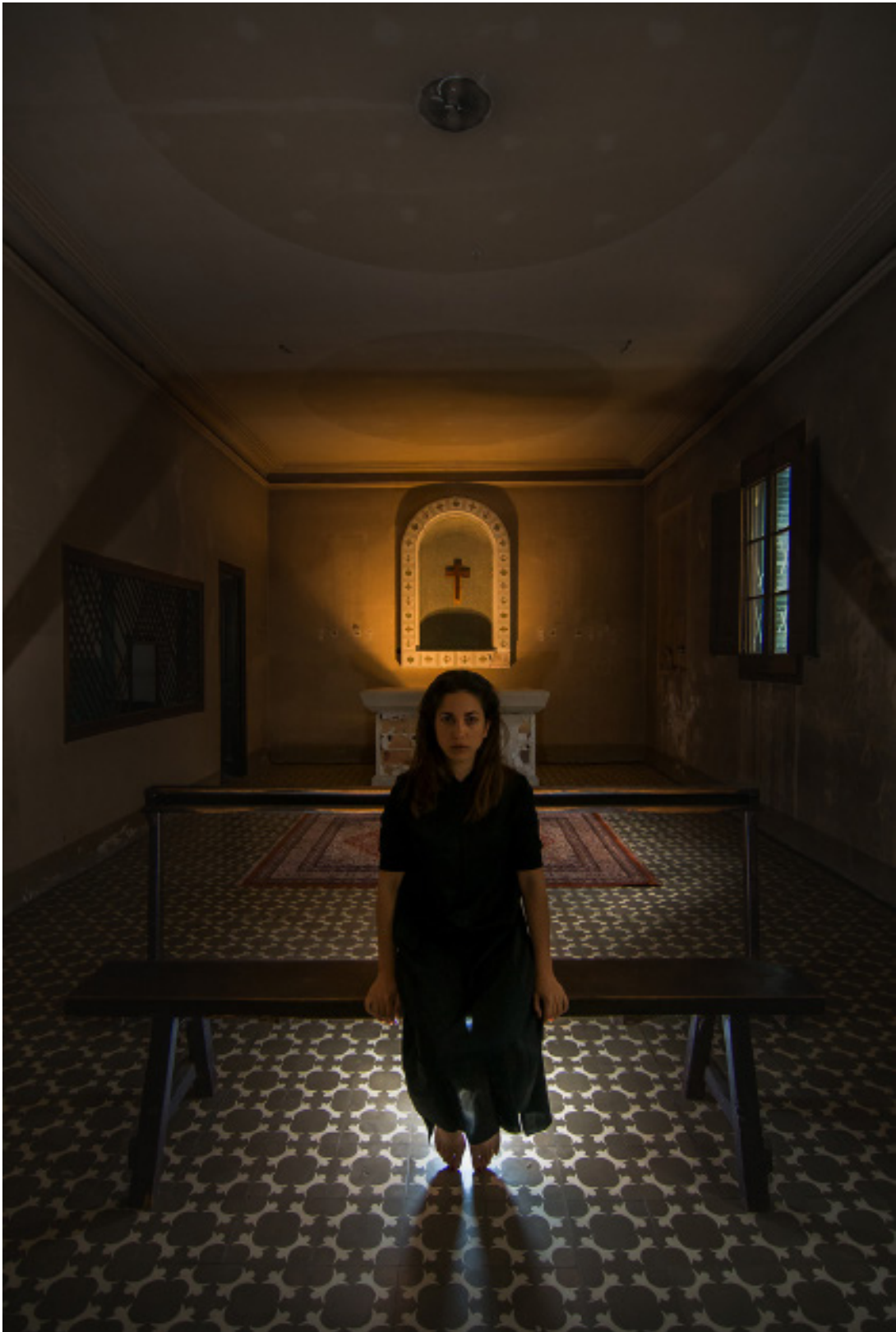
Título: The Habit Año: 2017 Técnica: Digital Photography Tamaño: 30 x 40 cm Ed.: 10 Tamaño: 40 x 60 cm Ed.: 5