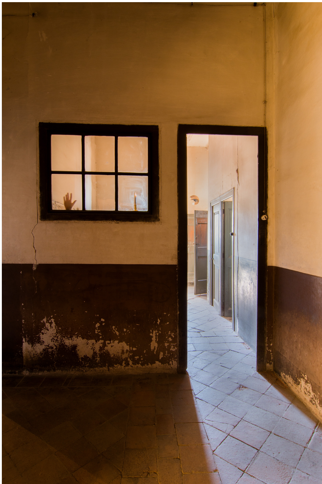
Título: Watch Yourself, Año: 2017 Técnica: Digital Photography Tamaño: 30 x 40 cm Ed.: 10 Tamaño: 40 x 60 cm Ed.: 5