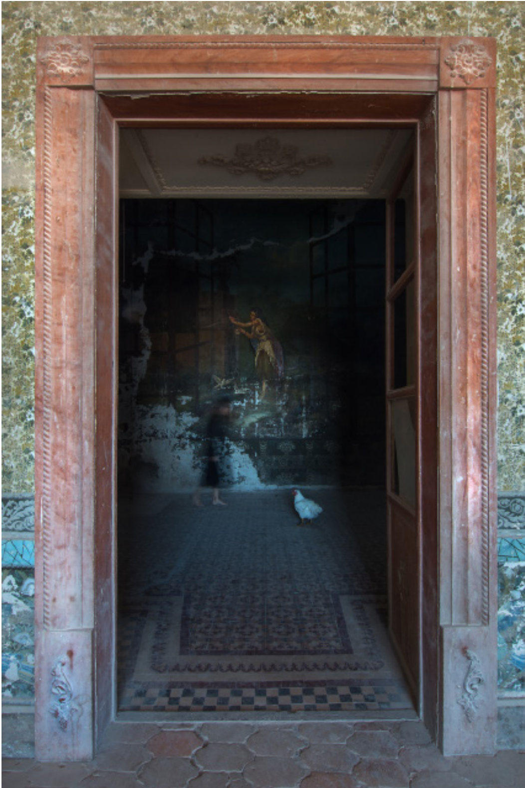
Título: The Trace of fallen Tears, Año: 2019 Técnica: Digital Photography Tamaño: 13 x 18 cm Ed.: 10 Tamaño: 40 x 60 cm Ed.: 5