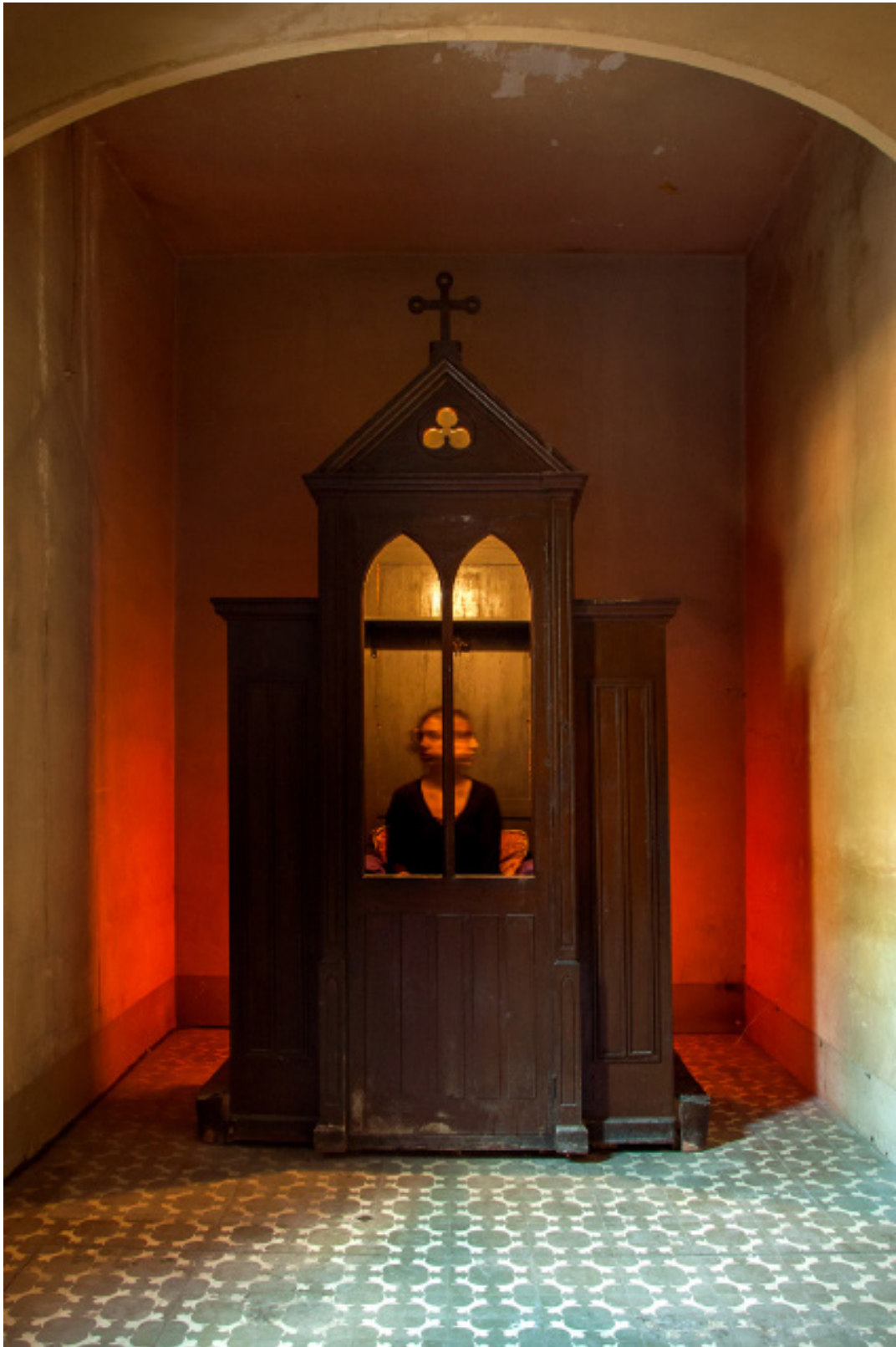
Título: Two Faces Año: 2012 Técnica: Digital Photography Tamaño: 30 x 40 cm Ed.: 10 Tamaño: 40 x 60 cm Ed.: 5